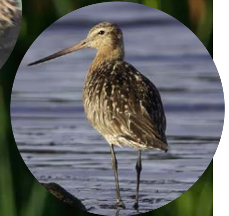
► Lille kobbersnepe