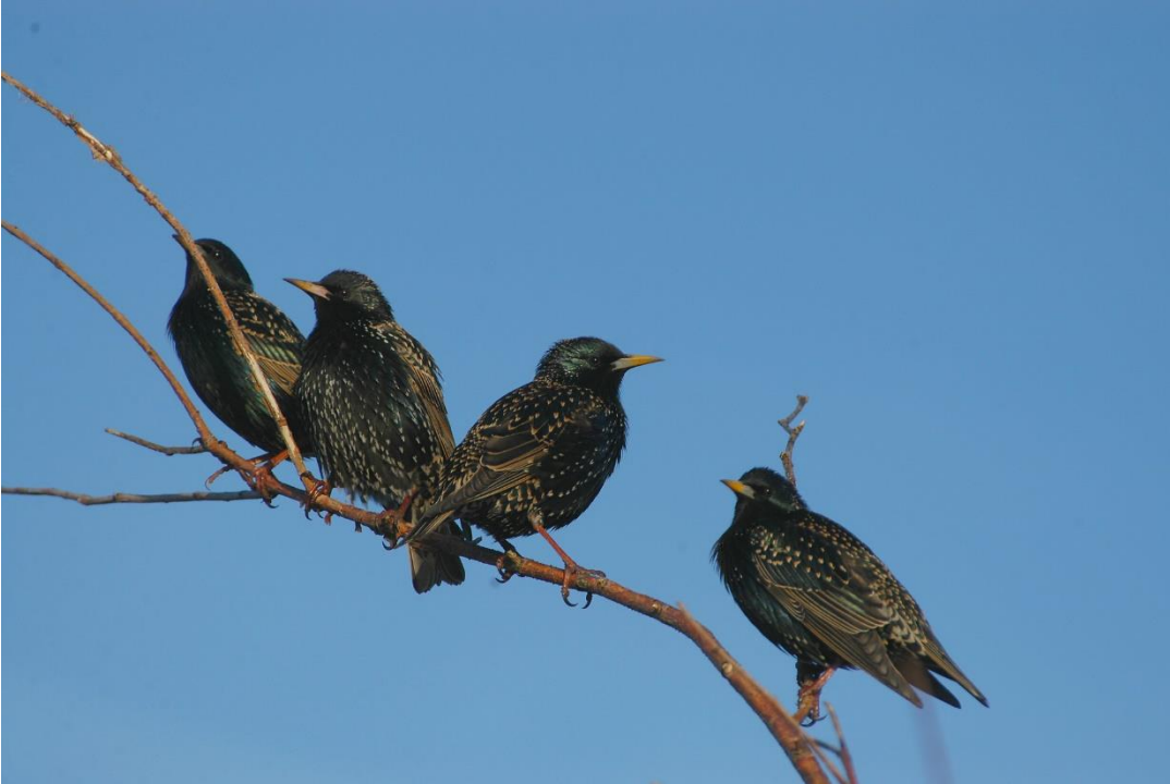
Stære.