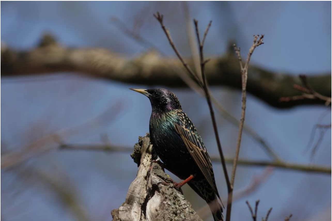
Stær.