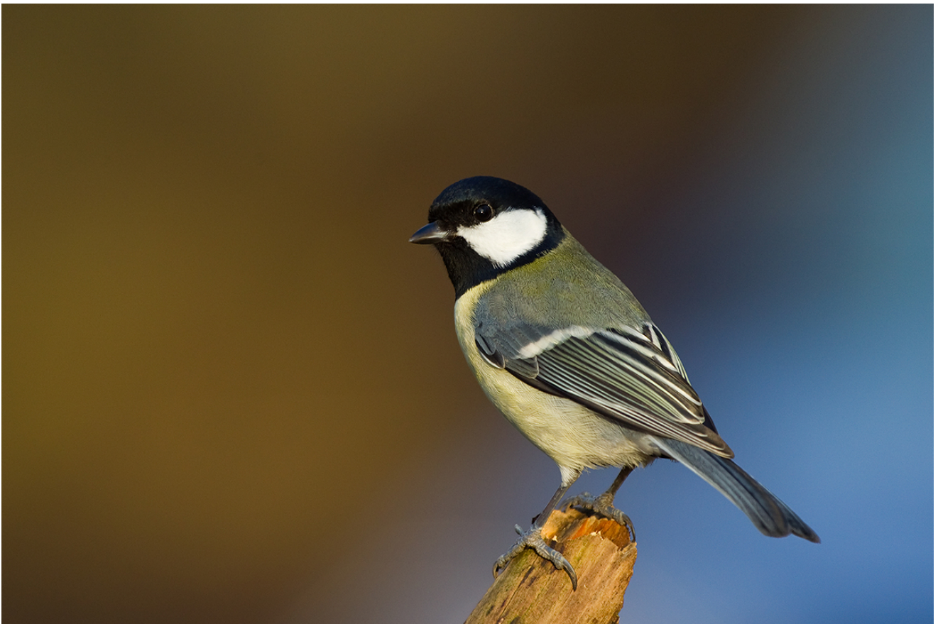
Musvitten er den art i Atlas III, der er blevet indtastet af flest forskellige deltagere.