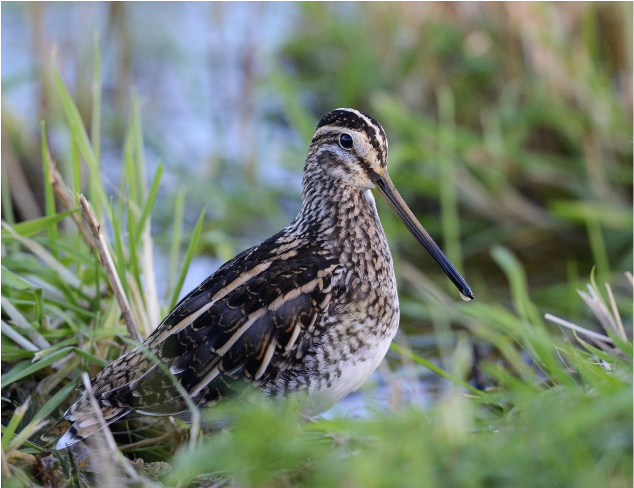
Dobbeltbekkasin.

Den sidstnævnte begrænsning gælder tillige for tab. 3-6, som alle er nogen, vi selv har fundet på, og som alle er åbenlyse hædersbevisninger. Disse hædersbevisninger ville vi gerne have præsenteret på et stort og festligt, afsluttende atlasårsmøde, men sådan skulle det altså ikke være. Læsere, der ikke er interesserede i flere hædersbevisninger, kan slutte her. Under alle omstændigheder skal alle atlasdeltagere endnu engang have en stor og varm tak for deres uvurderlige bidrag til Atlas III !